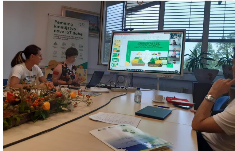
Farm4SD o stebrih trajnostnega kmetijstva

Na 2. mednarodnem projektne srečanju projekta Farm4SD, ki ga je organiziral BIOTEHNIŠKI CENTER NAKLO v hibridni obliki (preko spleta in v živo) v Naklem v Sloveniji. Partnerji so imeli priložnost razpravljati o rezultatih pripravljenih poročil. Poleg tega so sprejeli sklepe o napredku prvega projektne rezultata - R1 Metodološki okvir